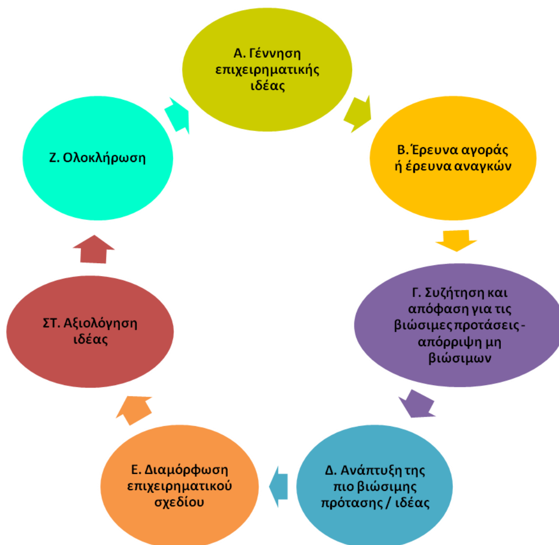
Σχήμα 2. Απεικόνιση μεθοδολογίας και βημάτων

Το πρώτο βήμα είναι η σύλληψη, η γέννηση της επιχειρηματικής ιδέας και ο ορισμός των στόχων και των διαστάσεων ή παραμέτρων που την προσδιορίζουν (π.χ. σε ποιο τμήμα της αγοράς ή σε ποιες ανάγκες της τοπικής κοινότητας) στοχεύει η κοινωνική επιχείρηση;